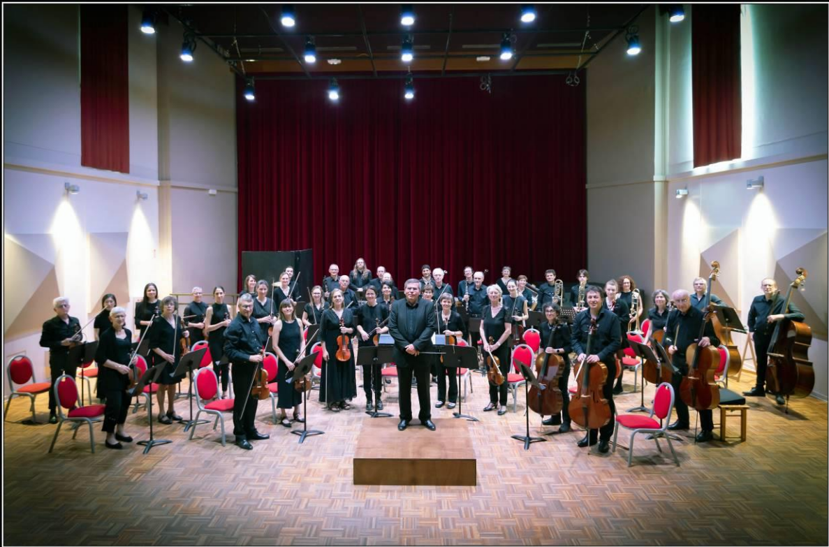
Concert Salle Messiaen, le 26 mai 2023